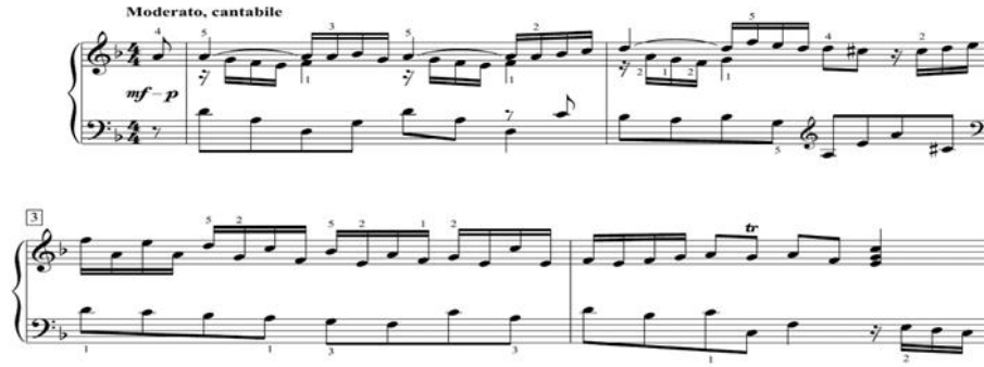
Nota 8: George Frideric Handel, "Allemande D - moll"

Gavotte: Fransız halk oyunudur. Gavot 'un zaman işaretleri 1/2, 2/4, 2/2, 4/4. Hareket ılımlı ve en küçük ses süreleri sekizlik notalardır. Başlangıçta Fransa'nın Güney ve Orta bölgelerinde, ayrıca Birleşik Krallık'ta hızlı bir halk dansı olarak gelişmiştir. 17. yüzyılda, Baptiste Lully tarafından saray ve salon müziği programlarına dahil edilmiş ve kural olarak sarabande 'den sonra süitin ayrılmaz bir bölümü olarak sık sık ortaya çıkmaya başlamıştır. Yayıldığı ülkeler olan Avrupa ve Güney Amerika. Rus bestecileri Pyotr Çaykovski, Aleksandr Glazunov ve özellikle Sergey Prokofiev'in bestelerinde gavot görülebilir.