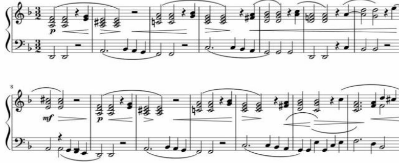
Nota 3: George Frideric Handel, "Sarabande"

17. yüzyılın ortalarından itibaren sarabande gigue'den önce yerleşmiş ve enstrümantal dans takımının kalıcı bir bölümüne dönüşmüştür. Bu türün en yüksek formu – G. F. Handel ve J. S. Bach'ın enstrümantal süitlerinde görülebilir. İlave olarak söylemek gerekir 20. yüzyıldan beri, Neoklasik eğilemleri belirgin birçok bestecinin enstrümantal eserleri arasında sarabandeler bulunmaktadır.