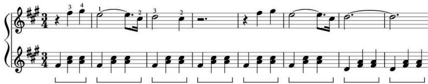
Nota 4: Evgeny Grinko, "Vals fis – moll"