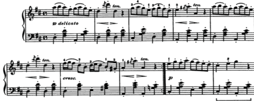
Nota 9: François Gossec, "Gavotte D - dur"

Gavotte: Fransız halk oyunudur. Gavot 'un zaman işaretleri 1/2, 2/4, 2/2, 4/4. Hareket ılımlı ve en küçük ses süreleri sekizlik notalardır. Başlangıçta Fransa'nın Güney ve Orta bölgelerinde, ayrıca Birleşik Krallık'ta hızlı bir halk dansı olarak gelişmiştir. 17. yüzyılda, Baptiste Lully tarafından saray ve salon müziği programlarına dahil edilmiş ve kural olarak sarabande 'den sonra süitin ayrılmaz bir bölümü olarak sık sık ortaya çıkmaya başlamıştır. Yayıldığı ülkeler olan Avrupa ve Güney Amerika. Rus bestecileri Pyotr Çaykovski, Aleksandr Glazunov ve özellikle Sergey Prokofiev'in bestelerinde gavot görülebilir.