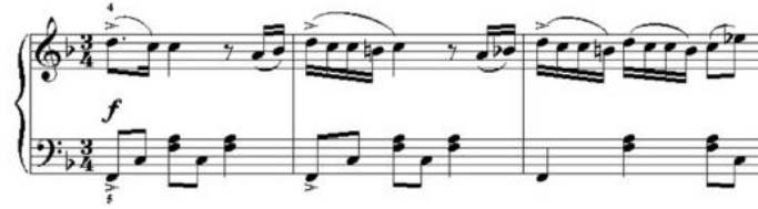
Nota 7: Frederic Chopin, "Polonez F – dur"

Polonez: Polonya kökenli ılımlı hızda ve ciddi bir dans alayıdır. Polonez dans eden çiftler kuralların bilerlediği geometrik şekillere göre hareket etmişlerdir. Dansın müzikal ölçüsü 3/4'tür. Polonya'da 15. yüzyılda "Chodzony" adı altında ortaya çıkan "Polonaise", ilk başta yalnızca bir düğün dansıydı. Değiştikten sonra, herhangi bir ulusal kutlamanın vazgeçilmez özelliği haline geldi. Bu dans birçok halk festivalinde programı açan dansdır. Genellikle ölçülü ve pürüzsüz "Polonaise", "Mazurka" veya "Oberek" gibi başka halk dansları ile programa serpiştirilmiştir ve müzisyenlerin tempoyu hızlandırılması ve daha hızlı danslara geçiş alması önceden planlamadan yapılırdı. Polonez, Polonyalılar arasında en popüler halk danslarından biriydi. 16.-17. yüzyıllarda kızlar çelenk takarak chodzony dansı yapar, gizlice onları takip eden genç erkeklere bakardılar. Kızların çelenkleri çıkarıp sevdikleri erkeklere vermesiyle dans çiftleri oluşturulurdu. Bu gibi durumlarda gençlerin evli kadınlarla veya dullarla dans etmelerine izin verilmiyordu.