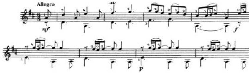
Nota 5: Anonim besteci, “Gigue D – dur”

Gigue: İtalyanca giga , Fransızca gigue , İngilizce jiga Barok zamanına ait edilen bir İngiliz dansıdır ve ayrıca korsan denizcilerinin oyunu söylenmektedir. Bu dans, 17. yüzyılın ortalarında Fransa’da yayılmış, genellikle süitin sonuna dahil edilmiştir. Muhtemelen gigue hiç zaman saray dansı değildi, ama genellikle soylular tarafından gerçekleştirildi ve birkaç saray bestecisi bu gösteri için müzik yazmıştır. Gigue danslarının boyutları – 3/8, 6/8, 6/4, 3/4, 9/8 veya 12/8’dir, ama ilk gigue’lerde başka boyutlarda vardır: Johann Bach tarafından 2/2 boyutta gigue yazılarını görebiliriz. Bach klavir için yazdığı “İngiliz Süitleri” toplusuna gigue dansını dahil etmiştir. Birkaç bestecilerin eserlerinde bu dans türünü işitebiliriz. Başka milletlerin halk oyunları gibi gigue dansı geliştirilerek zaman içinde var olmayı başarmıştır.