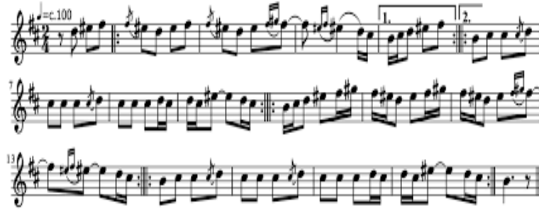
Nota 12: Anonim besteci, “Verbunkoş”