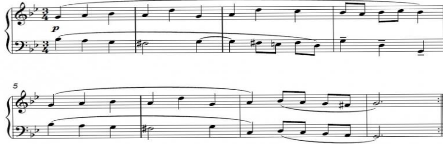
Nota 10: Johann Sebastian Bach, “Menuet G – moll”

Viyana klasik yüksek okulunun bestecileri Joseph Haydn, Wolfgang Mozart ve Ludwig van Beethoven bestelerine menuet müziğini dahil etmişlerdir. Beethoven'ın sonraki senfonilerinde menuet scherzo formuna geçiş yapılır. 19. yüzyılda menuetler Pyotr Çaykovski, Aleksandr Glazunov, Mihail Glinka, Anton Rubinshtein, Claude Debussy, Erik Satie ve başka besteciler tarafından yazılmıştır. Bir dans olarak menuet oynama modası geçmiştir, ama menuetin müzik, bale ve dans sanatındaki formu hiçbir şekilde unutulmamıştır.