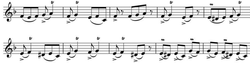
Nota 28: Elekber Esgerov, “Zöhrabi” Dans Melodisi

Daha sonra, Elekber Esgerov ton dizilerinden kullanarak melodini farklı besteledi. Milli makamlar üzerinde arařtırmalar yaparak bu ezgide bayatı-şiraz , rast ve segah makamlarına uygun unsurlar duyabilir. Besteci, bu dans melodisini yaparak nağaranın özelliklerini ve teknik çalgı üsluplarını vurgu işaretleri ile gösterebilmi. Notalarda vurgu ve trel işaretlerini tüm çizgilerde görebiliriz.