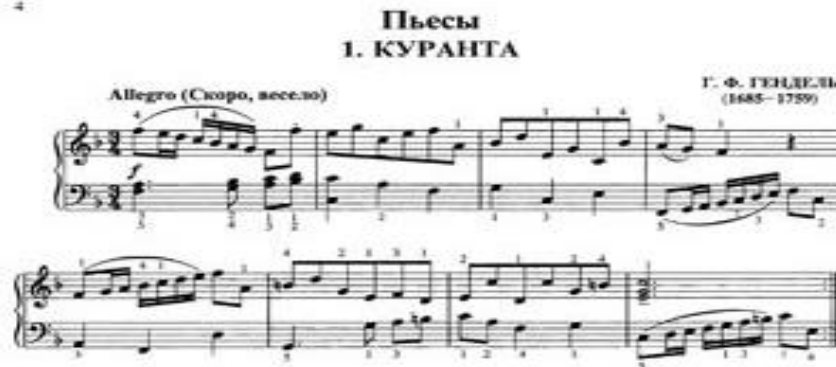
Nota 2: George Frideric Handel, "Courante No 1"

15. yüzyılda, İtalyan tatlilerinde büyük değişiklikler geçirmiş ve performans şekli değiştirilmiştir. Dansın hareketleri daha karmaşık hale getirilmiş, atlamalar daha az keskinleşmiş ve ölçü 3/4, 3/8 olmuştur. Oyunun özellikleri 16. yüzyılın ortalarına kadar korunmuştur. 16. yüzyılın ortalarında dansın Fransız versiyonu Paris'te ortaya çıkmıştı. Courante dansının ölçülen adımlara karşı ılımlı bir temposu vardı ve o yüzden pratik bir şekilde sıçramasız performans yapılmıştır. Bu dansın formu sonralar geliştirilerek daha modern bir formulu alarak yayılmaya başladı. Bu bakımdan, courante'nin iki türü 18. yüzyılın başında eski moda ve pratik kullanım dışı olarak kabul edilmeye başlanan bir çift allemande idi.