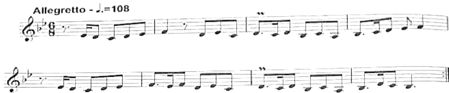
Nota 13: (Guliyev ve Guliyeva, 2011:28)