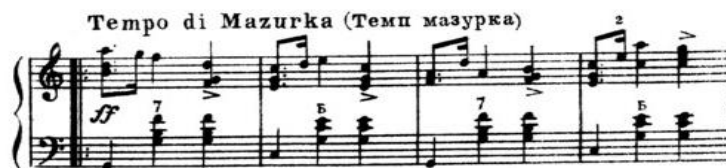
Nota 6: Henrik Venyavski, “Mazurka”

Chopin’in etkisi altında diğer besteciler de mazurka dans melodilerini yazmışlardır.