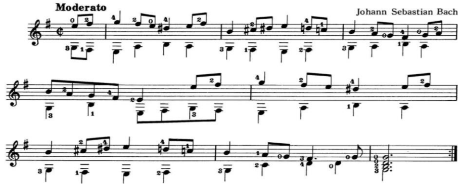
Nota 1: Johann Sebastian Bach, "Bouree"

Courante: İtalyancada corrente ve Fransızcada courant koşan, akan demektir. Tarihi 16. yüzyılın ortalarına kadar uzanan bir Fransız dansıdır. Ölçüsü temelde 3/4'tür ve başlangıçta "Galiard" ve "Saltarella" türlü atlama danslardan kaynaklanan 2/4 zamanlı bir köylü oyunu olduğu bilinmektedir.