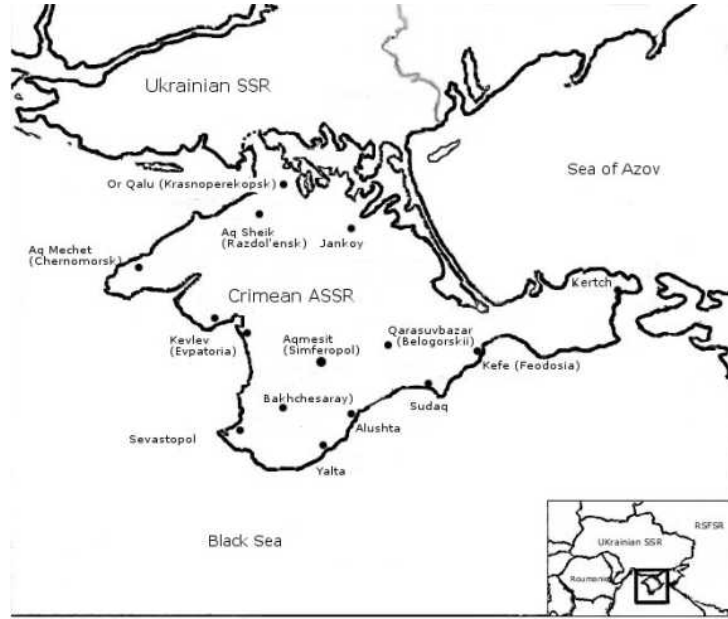
Kırım Özerk Sovyet Sosyalist Cumhuriyeti Haritası

18 Mayıs 1944'te Sovyet Hükümeti, Kırım'ın 3 yıldır Nazilerin işgali altında olduğunu öne sürerek, Kırım'da hala yaşamakta olan Kırım Türkleri'nin cebren Orta Asya'ya, yakın Ural bölgesinin iç Rusya'sına ve Sibiry'a sürgün etti. Bu durum, İkinci Dünya Savaşı sırasında ABD veya Kanada'daki Japonların hapsedilmesiyle karşılaştırılmaz. Erkeklerin çoğunlukla Sovyet Ordusuna çağrılan ve savaş meydanlarında Nazilere karşı savaşan aileler, sabah saat 4'te Rusya İçişleri Bakanlığı özel hareket kuvvetleri tarafından uyandırıldı. Kişisel eşyalarını toplamak için sadece 15 dakika izin verildi ve günün sonunda yiyecek, ilaç ve su olmadan hayvan tren vagonlarına "yüklemler". Böylece sürgüne gönderildiler. Yol birkaç hafta sürdü. Kırım Türkleri sürgün yerlerine ulaştıktan sonra, özel askerlik kontrolü altındaki bir tür köle köyünü temsil eden özel yerleşim yerlerine dağıtıldılar. Aileler bölündü, insanlar en zor ve zararlı işlerde çalıştırıldı. Sürgün sürecinde ve ilk 3 yıl boyunca, halkın %46'sından fazlası hastalıktan, insanlık dışı münasebetten ve açlıktan öldü.