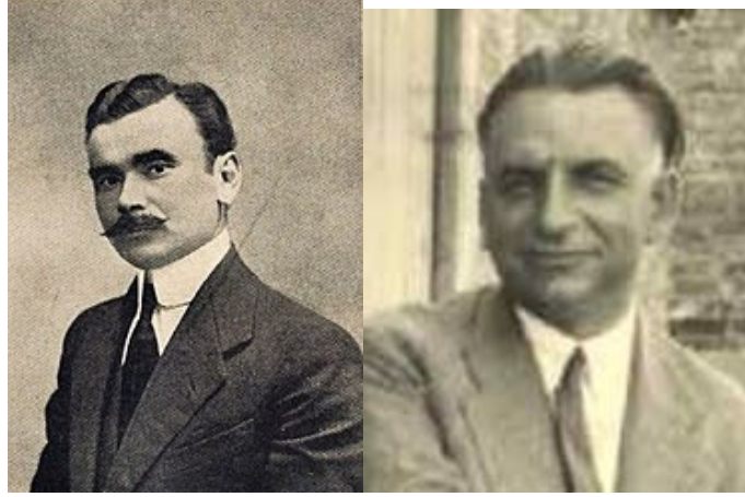
Noman Çelebicihan, Cafer Seydamet, Birinci Kurultay ve Kırım Demokratik Cumhuriyeti Liderleri 1917-1918.

Çelebicihan, Cafer Seydamet ve diğerleri) Kırım'ın Rus çoğunluğu ile bir çözüm bulmaya çalıştılar, çünkü XXVIII-XIX c.c. olayları nedeniyle o ana kadar Kırım'ın Yerli Halkı Kırım Yarımadasının toplam nüfusunun yalnızca %30'nu temsil ediyordu. Kısmen belirli bir ilerleme kaydettiler: askeri subayların bir kısmını da içeren yerel Rus politikacılardan, kimisi özel hükümlerin hem Kırım Türkleri hem de Slav çoğunluğu için eşit hakları garanti edeceği Kırım Halk Cumhuriyeti'ni kurma konusunda uzlaşma aramayı abul ettiler.(o dönem Ruslar ve Ukraynalılar birlikte Kırım nüfusunun %50'sinden fazlasını oluşturmaktaydı).