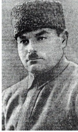
Veli İbrahimov, Kırım Özerk Sovyet Sosyalist Cumhuriyeti Merkez Yürütme Komitesi Başkanı (o dönemin Kırım Parlamentosu) 1921-1928.

O dönemde Kırım'daki baskı mağdurlarının kesin rakamlarına hiç kimse sahip değildi, ancak analitik yaklaşım muhtemel sayının 100 000'den fazla olduğunu göstermekte.